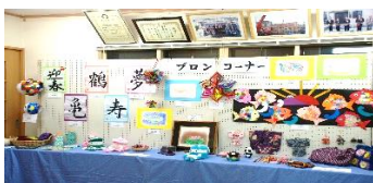
『今年もたくさん出品しました☆』