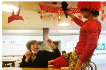
『豆を投げて、鬼はあー外！』