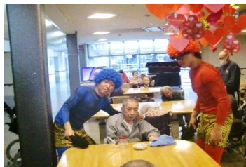
『鬼と一緒に、パチリ♡』