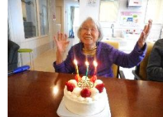
『おめでとうございます😊』