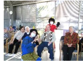
『鬼と記念撮影です📷👻』