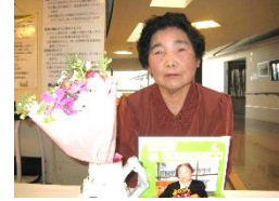
『誕生会の主役さん♡緊張してるのかな?』