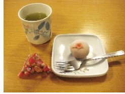
『今月のお菓子を紹介します😊』