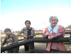
『暖かい日にはお散歩も♪』